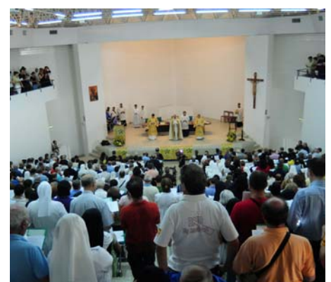
Un momento del convegno diocesano

Se vuoi pubblicare un tuo articolo su “Comunicando Vobis”, inviacelo all’indirizzo e-mail comunicando_vobis@libero.it