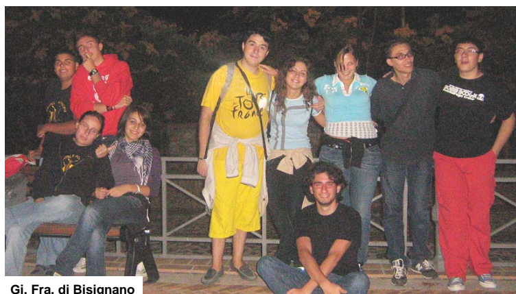
Gi. Fra. di Bisignano

purtroppo sorella pioggia ci ha impedito di continuare il cammino... e alle 3.00 circa i pullman ci hanno condotti lì dove dovevamo arrivare alle prime luci dell'alba, al convento di Sant'Umile, dove il Provinciale dei frati minori di Calabria, Padre Francesco Lanzillotta, ha presieduto la Santa Messa. In convento abbiamo aspettato l'alba... forse non nel modo in cui avevamo pensato... ma il Signore ci riserva sempre vie inaspettate... per arrivare alla Luce!