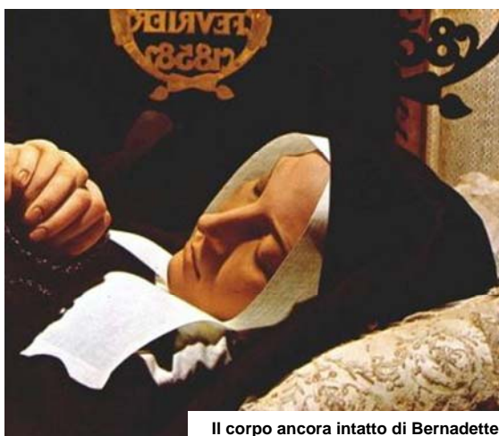
Il corpo ancora intatto di Bernadette

alla morte, il 16 Aprile 1879. Aveva solo 35 anni, ma il suo corpo era consumato dall'asma ma anche da