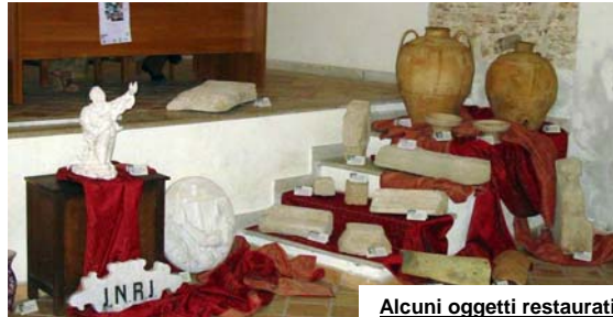
Alcuni oggetti restaurati

tervento di restauro. Complessivamente si è agito su «24 opere che possono essere raggruppate per