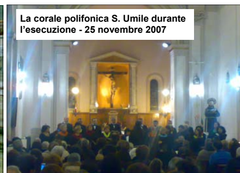
La corale polifonica S. Umile durante l'esecuzione - 25 novembre 2007