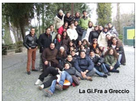
La Gi.Fra a Greccio