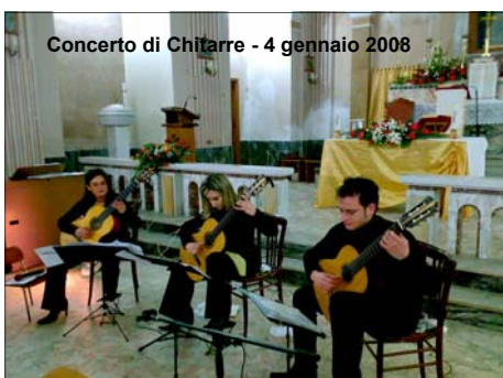
Concerto di Chitarre - 4 gennaio 2008