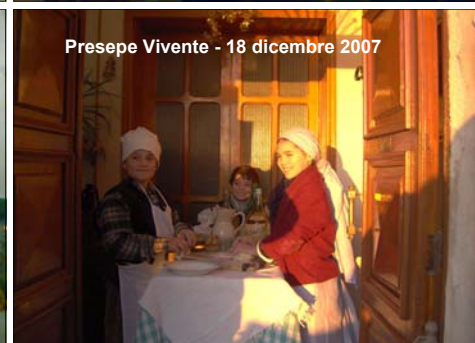
Presepe Vivente - 18 dicembre 2007