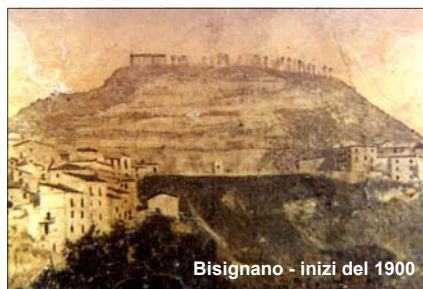
Bisignano - inizi del 1900

Q uella del 3 di dicembre è una processione votiva che si tiene per ricordare il terremoto del 1887 che distrusse quasi completamente Bisignano e per rinnovare, così, l'affidamento della città alla protezione del suo santo Patrono, San Francesco di Paola. Le cronache dell'epoca ci raccontano che era l'alba del 3 dicembre quando Bisignano venne colpita da due scosse, di cui la seconda fu disastrosa. La prima, che ebbe origine nel Vallo casentino, nella confluenza dei fiumi Duglia e Crati, si ebbe alle ore 4.50 circa e durò quasi un minuto. La seconda si ebbe due ore più tardi e fu terribilmente sussultoria e vorticoso, buttando giù case e danneggiando molti palazzi nobiliari e parecchie chiese, tra cui quella di S. Domenico, distrutta quasi del tutto con il suo magnifico rosone nella facciata. Il nobile Gaetano Gallo di Bisignano, che fu presente alla sciagura, racconta nei suoi scritti che «Bisignano, che alla prima scossa deplorava solo poche vittime ed alcuni edifici caduti, nella seconda, quando la popolazione s'era versata confusa sulle pubbliche vie, in un istante è andata in polvere». Per ogni parte del paese vi erano cumuli di macerie e il bilancio fu di 20 morti e 6 persone gravemente ferite,