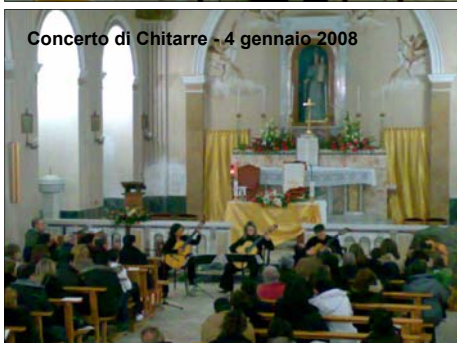
Concerto di Chitarre - 4 gennaio 2008