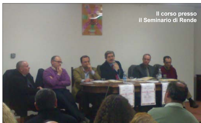
Il corso presso il Seminario di Rende