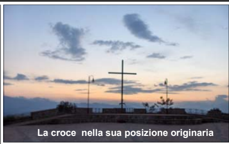
La croce nella sua posizione originaria

I l forte vento ha sradicato la Croce di Sant'Umile. È successo nella notte del 16 febbraio, quando su Bisignano si scatenava una forte tempesta. La croce di legno non ha così resistito al forte vento che l'ha scaraventata giù per il dirupo, evitando fortunatamente di finire sulle case sottostanti. L'impatto con il suolo poi, l'ha ulteriormente danneggiata, perché si è spaccata, divenendo perciò inutilizzabile. La croce, alta circa dieci metri, era situata nella piazza del convento di Sant'Umile. Erano ormai cinque anni che la croce era al suo posto, messa lì in occasione dei lavori di rifacimento del piazzale antistante l'antica chiesa della Riforma. In quell'occasione erano stati gli stessi frati di allora a