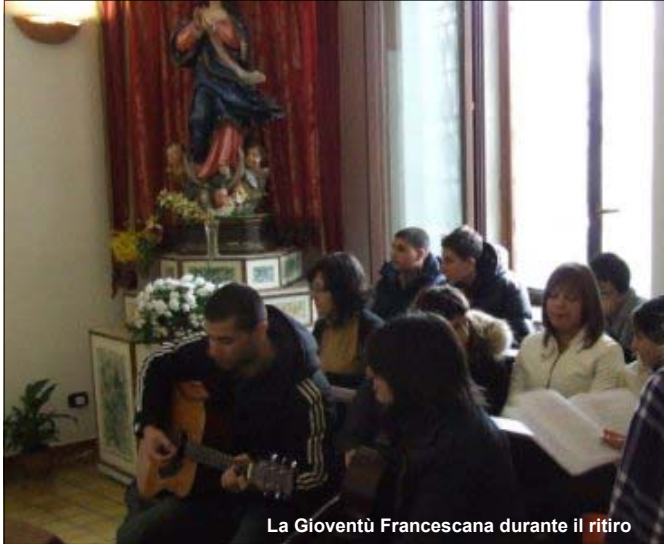
La Gioventù Francescana durante il ritiro

brano delle Fonti Francescane (FF 1168) su Francesco innamorato dei lebbrosi. Al termine della riflessione, c'è stato il momento di deserto e riflessione personale. Il momento del pranzo al sacco è stato vissuto in maniera fraterna e gioiosa da tutti quanti, che abbiamo sfruttato il poco tempo a disposizione per conoscerci e stare insieme. Nel pomeriggio abbiamo iniziato con la Liturgia della Passione di S. Francesco, seguita poi dalla testimonianza delle due Clarisse che abitano attualmente a Rende: un incontro bello ed importante soprattutto per chi per la prima volta conosceva questo stile di vita. Il ritiro si è concluso con la Celebrazione Eucaristica presieduta da Padre Eugenio Clemenza.»