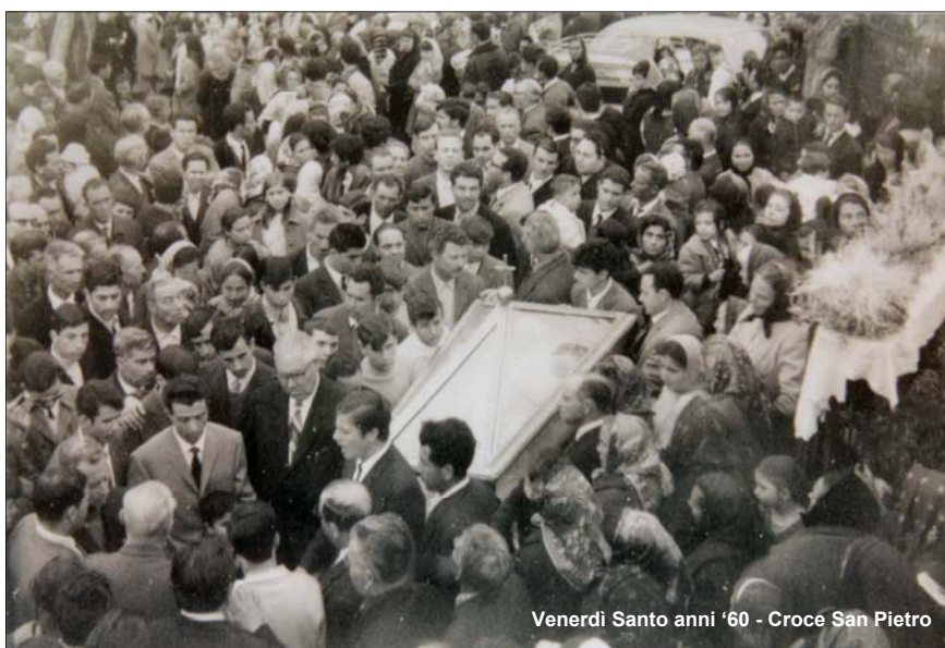
Venerdì Santo anni '60 - Croce San Pietro