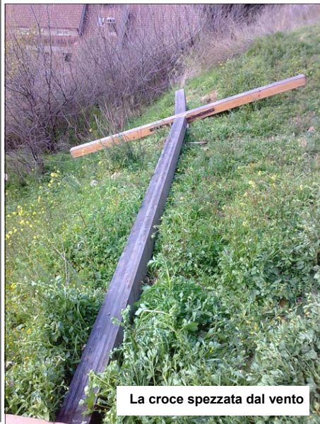
La croce spezzata dal vento

volerla. La sua altezza era stata pensata per essere visibile da diversi punti della città e per proteggere tutti i paesi vicini. La notizia ha suscitato subito un grande scalpore, soprattutto in coloro che, andando a Messa il giorno dopo, hanno immediatamente notato la sua assenza. La notizia si è presto diffusa per tutta la città, riscuotendo anche forte incredulità. Per i tanti devoti di Sant'Umile questo evento ha rappresentato un brutto episodio, anche perché erano molti quelli che ormai vedevano in quella croce un punto di riferimento. Il commento unanime espresso è stato quello di rivedere presto quella croce al suo posto.