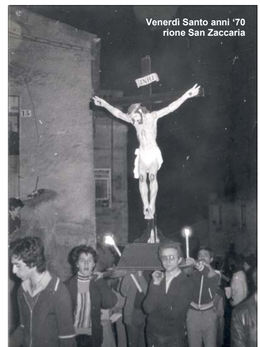
Venerdì Santo anni '70 rione San Zaccaria