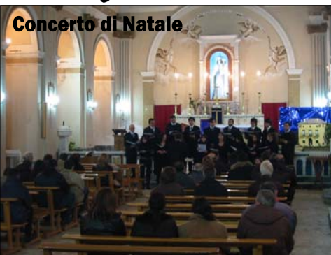
Concerto di Natale