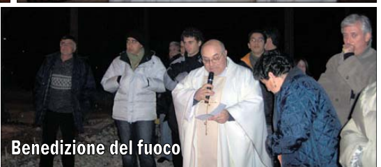
Benedizione del fuoco