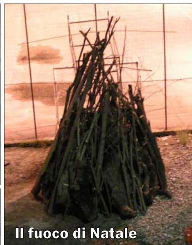
Il fuoco di Natale