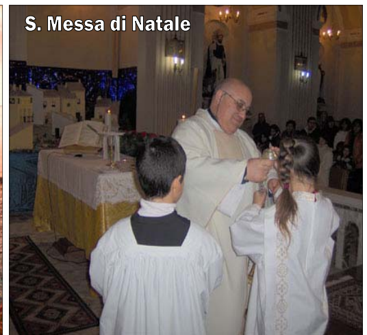
S. Messa di Natale