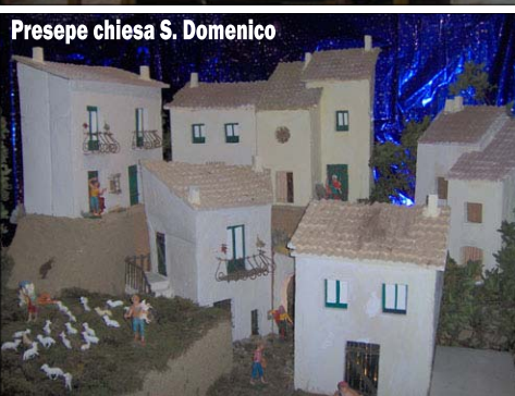
Presepe chiesa S. Domenico