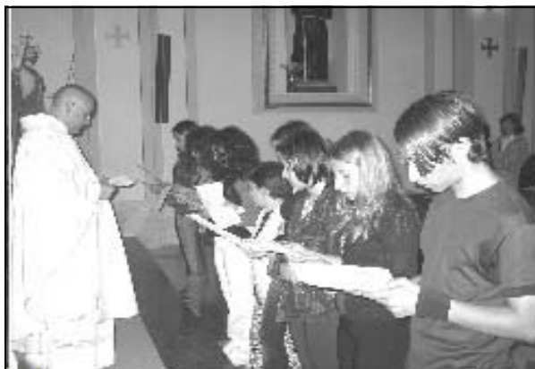
Adolescenti durante la professione

Oggi la nostra fraternità conta oltre 30 giovani suddivisi in 4