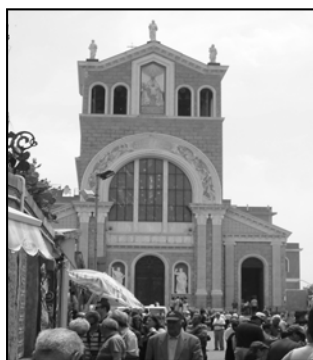
Santuario del Tindari