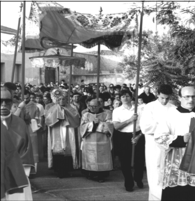
Processione del Corpus Domini

Con l'espressione Corpus Domini, ovvero "Corpo del Signore", la religione cattolica indica la festività del corpo e del sangue del Signore, che ricorre di giovedì, 60 giorni dopo la Pasqua. La Chiesa in Italia, dopo l'abolizione delle festività infrasettimanali, la celebra la domenica successiva per solennizzare il mistero eucaristico. La festa del Corpus Domini trae origini dalle narrazioni di Giuliana di Retine priora di un Monastero presso Liegi alla quale durante un'estasi il Signore rivelò l'opportunità di una solennità in onore del S.S. Sacramento. A seguito di ciò venne presentata la richiesta di introdurre una festa, la quale fu accolta nel 1246. Più tardi, Papa Urbano IV estese la festa a tutta la Chiesa, sembra anche grazie al miracolo di Bolsena. Questo fu un evento straordinario, in cui un prete boemo, poco convinto della transustanziazione (Trasformazione della sostanza del pane in sostanza del corpo di Cristo), avrebbe visto sanguinare l'ostia durante la celebrazione eucaristica. Il Corpus Domini, come ufficio festivo, risale a Tommaso d'Aquino, mentre la processione con il S.S. Sacramento ha iniziato a diffon-