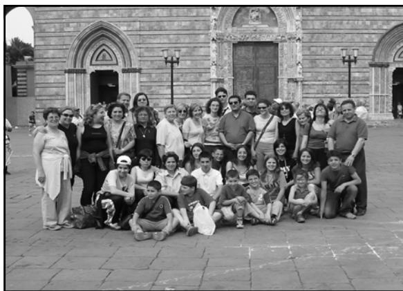
Foto di gruppo davanti al Duomo di Messina

“Anche noi come gli Apostoli abbiamo voluto celebrare la Pentecoste sotto lo sguardo di Maria”